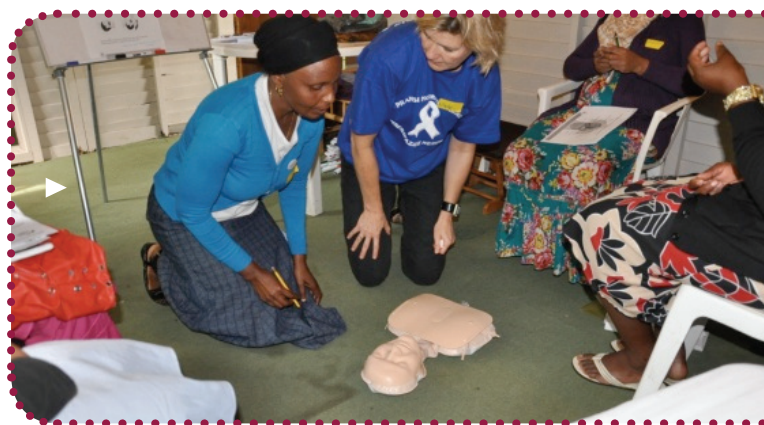
Frivillige fra RAW og CSHELP i gang med at yde førstehjælp til George Clooney, som dukken blev døbt.