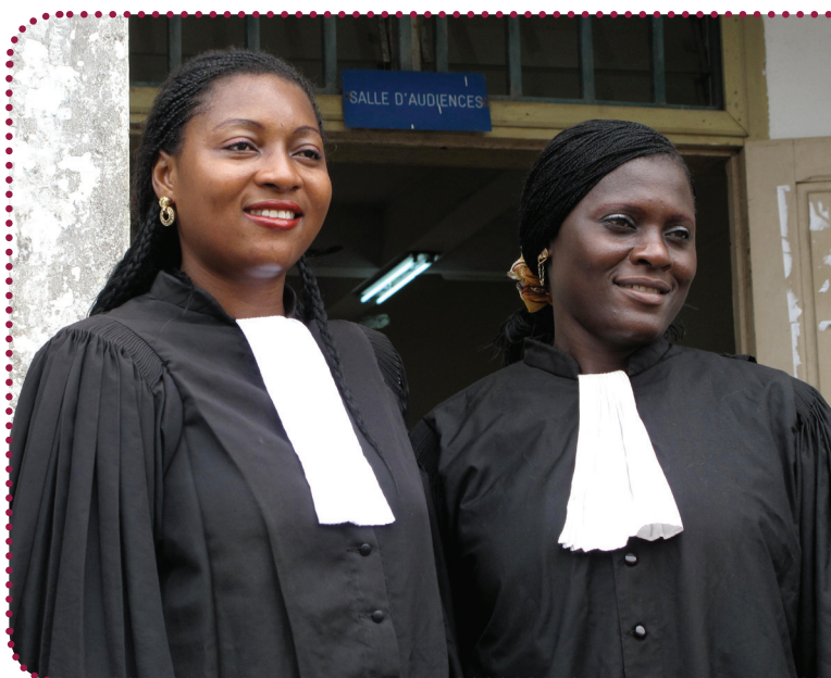
2 af WCICs advokater.

WCIC Women's Counselling and Information Centre