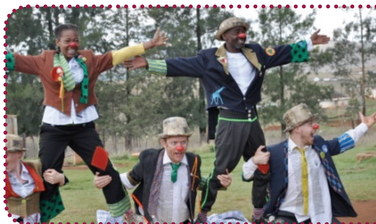
Klovne uden grænser.