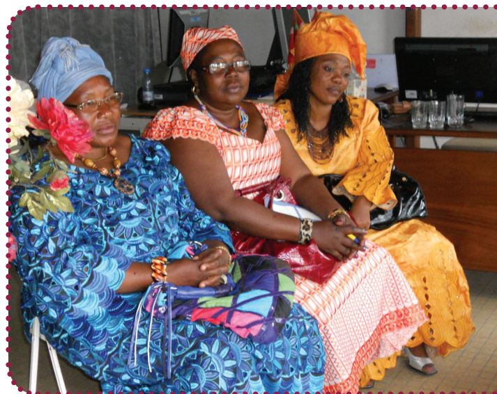
Kvinder fra Womens Associations fortæller RAW om deres erfaringer

Evalueringen viser bl.a., at rådgivning og retshjælp til fattige kvinder nu virkelig er en solid og fasttømret del af WCICs arbejde. Arbejdet varetages i det daglige af WCICs projektassistent, som også sikrer