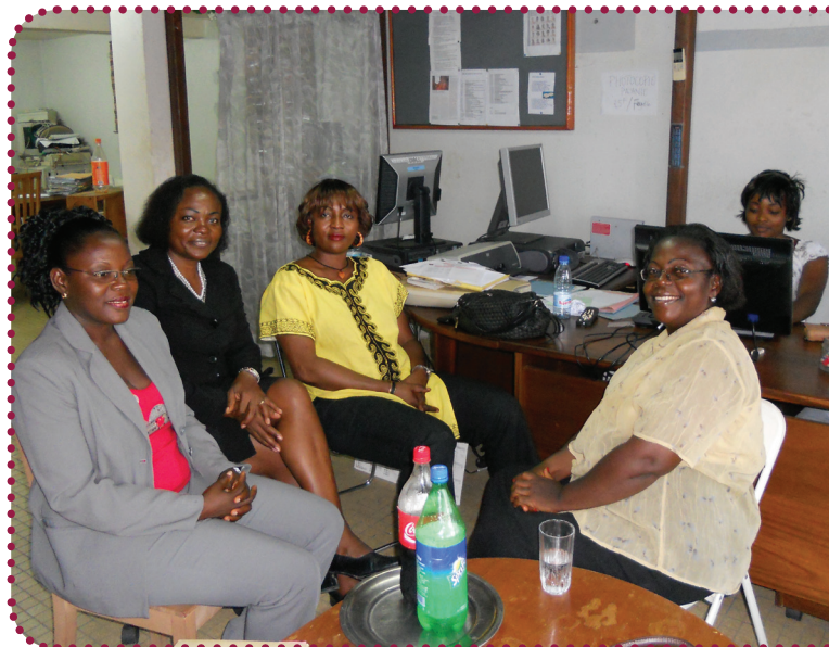
WCIC's ansatte og netværkspartnere holder en tiltrængt pause

Med andre ord har WCIC virkelig konsolideret sig på de områder af projektet, som vedrører målgruppen af fattige kvinder og kampen for kvinders rettigheder generelt. Udfordringen er at få WCICs organisatoriske infrastruktur til at vokse med udviklingen af de udadrettede aktiviteter. Det bliver derfor også et vigtigt fokus de næste 4 år. ■