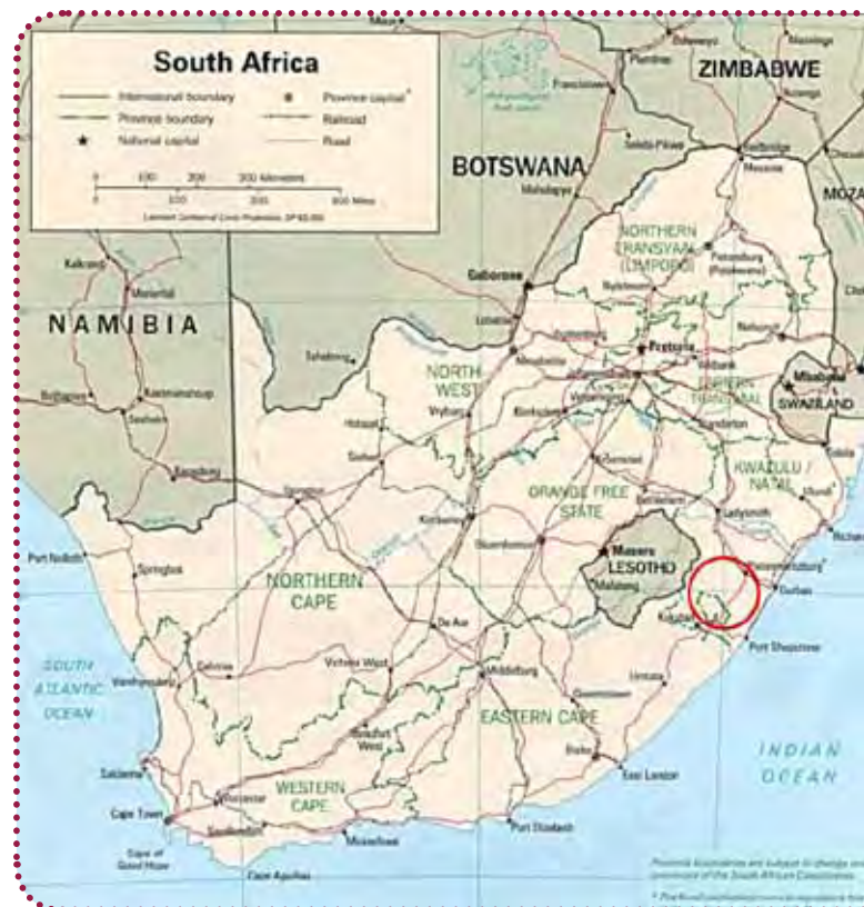
Den røde cirkel på kortet viser ca. det område RAW arbejder i.

I februar 2011 rejste to frivillige fra RAWs Århusafdeling til Sydafrika for at starte projektet. På turen gennemgik RAW og CSHELP projektet i detaljer og drøftede hvad der først skal iværksættes. ▶