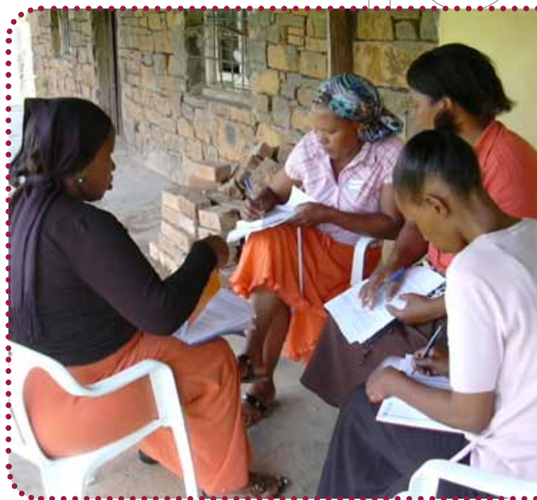
Billedet er taget fra workshop under turen i februar 2011

Et formål på turen var også at underskrive samarbejdskontrakterne imellem RAW og CSHELP. Dette blev gjort i forbindelse med 'Braai', der på sydafrikansk betyder grillaften. Ud over en spændende oplevelse, var der lejlighed til at møde CSHELPs bestyrelsesmedlemmer med familier og byde hinanden velkommen i projektsamarbejdet under hyggelige rammer. ■