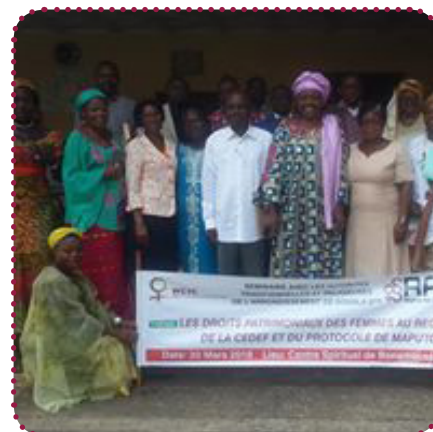
Seminar med religiøse og traditionelle ledere i Douala 5eme marts 2018